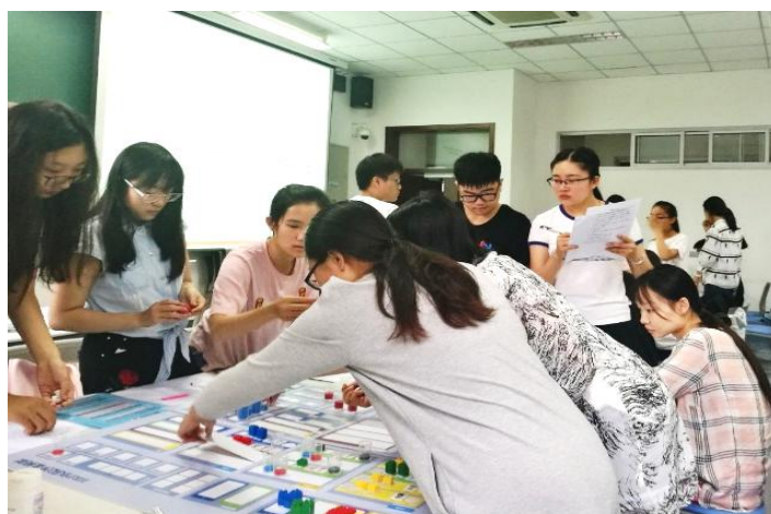
多形式教学-沙盘教学

健康管理学 2017 年开始招生，是中医学下自主设置二级学科，授予医学硕 士学位。