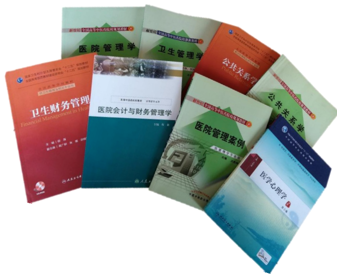
我院教师部分主编及参编教材

学院在中医药管理教育领域发挥引领作用，在中医药院校中率先开设卫生事业管理本科、社会医学与卫生事业管理硕士，中医药管理博士专业，众多研究方向和课程独具特色，学院教师主编及参编教材 104 部，其中主编教材 43 部，副主编教材 36 部，编委参编教材 40 部；主编副主编各级各类规划教材 22 部。