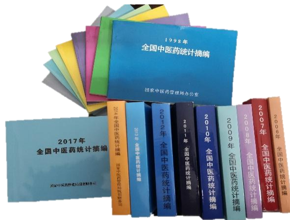
我院连续 20 年编制全国中医药统计摘编

研究成果在引领行业发展、推动健康及中医药领域政策制定、丰富卫生管理理论、倡导积极健康观念中发挥了重要作用，在中医药院校的管理学科中发挥了标杆作用。