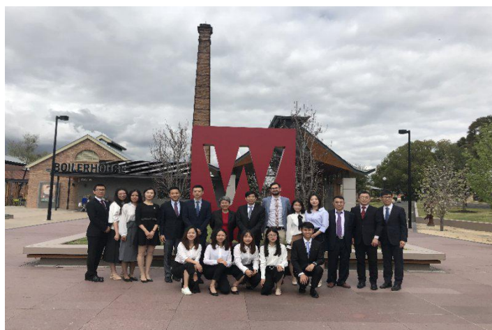
我院学生赴澳大利亚西悉尼大学短期交流

学院积极邀请国内外知名学者专家来我院进行学术交流，选派教师、学生赴海外知名高校进行交流学习，鼓励和资助优秀研究生赴海外参加高水平国际学术会议，以促进研究生参与国际交流与合作，了解相关学科领域研究前沿和国际最新进展，拓展研究生的国际化视野并提升实践、创新能力，进一步提高研究生培养质量。