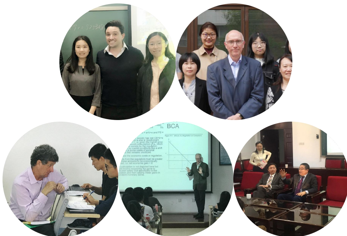
外专引智项目邀请世界各地相关领域研究者来校进行短期授课和开展合作交流